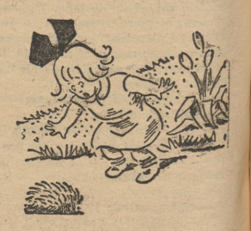
Mamo, mamo, twoja poduszeczka ze szpilkami ucieka!

REDAKCJA i ADMINISTRACJA Konto P.K.O. 700.312. Konto rozrach. 1, Wilno 1 Centrala. Wilno, ul. Biskupa Bandurskiego 4 Redakcja: tel. 79. Godziny przyjęć 1—3 po południu Administracja: tel. 99—czynna od godz. 9.30—15.30 Drukarnia: tel. 3-40. Redakcja rękopisów nie zwraca.