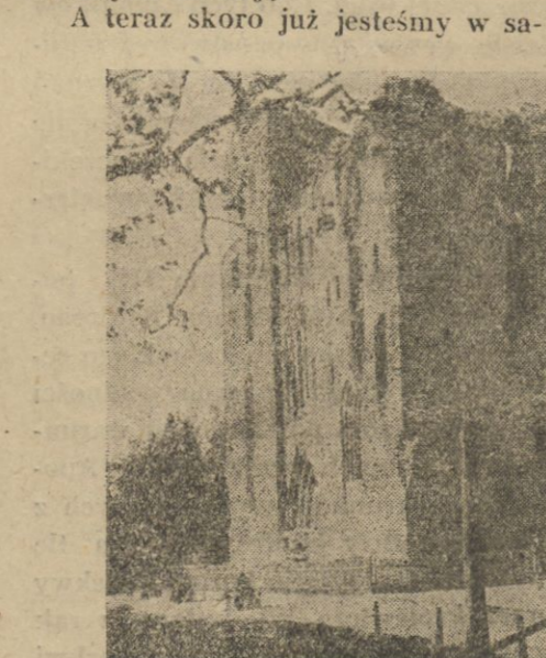
Na Dombergu — Ruiny, zniszczonej w w. XVI katedry i rezydencji biskupiej, w odnowionej swej części — będącej od kilkudziesięciu lat siedzibą Biblioteki Uniwersyteckiej.