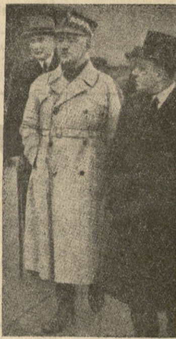
Z lewej za generałem Sikorskim, minister spraw zagr. August Zaleski.