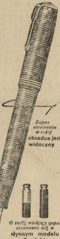
Zapas atramentu w całej obsadce jest widoczny

Obejrzyjcie dziś jeszcze to modne, nowoczesne pióro w jednym z lepszych sklepów piór wiecznych.