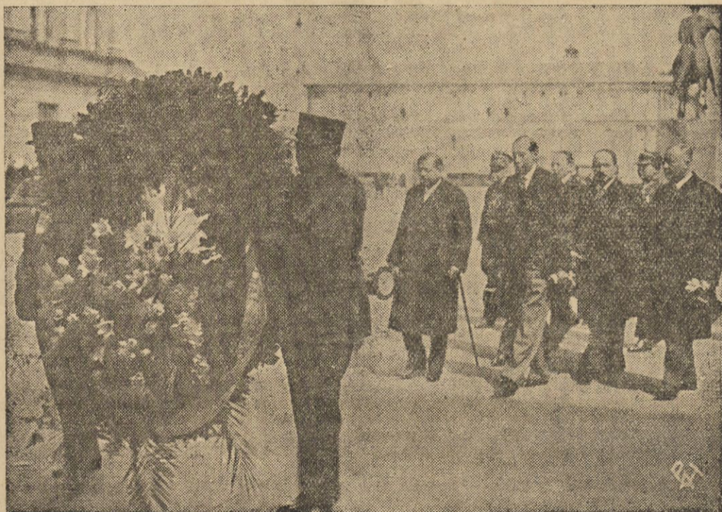
Minister Laval składa wieniec na Grobie Nieznanego Żołnierza