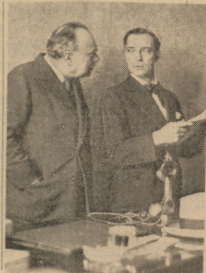
Buster Keaton we Francji.

— Pierwszy wielki film Wallace Beery i Jacka Coopera od czasów pamiętnego „Czempa“, — „Przedmieście“, odniósł olbrzymi sukces. Cała prasa filmowa i literacka wyraża się o nim z jedogłośnym i szczerym entuzjazmem. W związku z genialną kreacją Wallace Beery w „Przedmieściu“, został on zaangażowany z nowym rokiem do wytwórni „London Films“, gdzie słynny reżyser Aleksander Korda, twórca „Henryka VIII“, ma dla niego specjalnie napisany scenariusz.