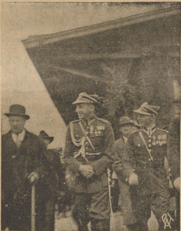
W Wilnie odbył się niedawno obchód 20-lecia 1-go p. art. 1. Leg., na który przybył m. in. w mundurze pułkownika artylerji min. Spraw