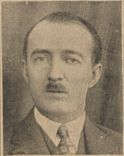
Achmed Zogu I, król Albanji.

W dniu rocznicy ogłoszenia monarchii woprzek ulic Tirany rozwieszono olbrzymie, czerwone transparenty, na gmachach wesoło łopoczą czerwone chorągiewki. Czerwone są mundury gwar-