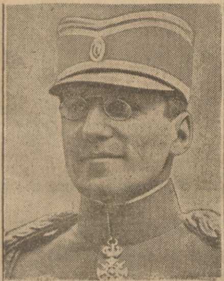
S. p. król Aleksander.

PARYŻ, (Pat). Lądowanie króla Aleksandra odbyło się w porcie marsylskim o godz. 16.10 wedle przepisanej ceremoniału. Król siadł do powozu i orszak królewski wyruszył ulicami miasta w kierunku prefektury. Koło giełdy, gdzie skupiło się wielu widzów, z pośród tłumu padło około 20 strzałów. Król został ranny 3 kulami.