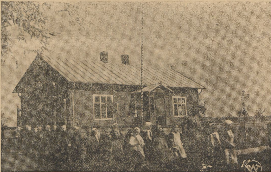
Tydzień bieżący poświęcony jest zbiorce funduszy i propagandzie zagadnienia budowy szkół powszechnych. Na zdjęciu wzorowa jedna klasowa szkoła powszechna we wsi Przemysłów powiatu łowickiego. Około domu mieści się ogród i boisko. Powiat łowicki jest jednym z tych powiatów w kraju, który posiada wzorowe szkoły powszechne m. in. szereg szkół wyższoklasowych.