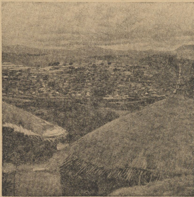
Na mocy zarządzenia cesarza Abisyńji zostały zamknięte wszystkie szkoły w Harrarze i Dżidzie. Zarządzenie to miało być wywołane obawą przed uderzeniem wojsk włoskich na te miasta, co spodziewane jest w tych dniach. — Na ilustracji — miasto Harrar o 80.000 mieszkańców, drugie co do swej liczebności miasto Abisyńji.