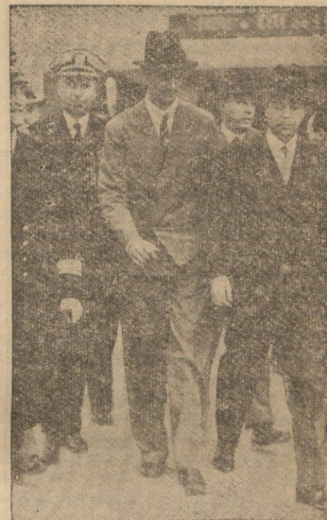
Hughes w towarzystwie ambasadora Stanów Zjednoczonych Bullitta na lotnisku pod Paryżem.

NOWY JORK. (Pat.) Lotnik Hughes wyładował dziś o godz. 14,38 (czasu londyńskiego) w Minneapolis (stan Minnesota). Lądowanie nastąpiło po 6-godzinnej przerwie łączności radiowej z lotnikiem. Tra-