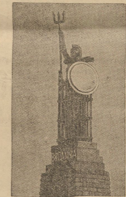
Zdjęcie przedstawia pomnik „Brytanii” postawiony przez Francję w porcie Boulogne na pamiątkę wspólnej walki Francuzów z Anglikami podczas wojny światowej. Pomnik specjalnie został wykonany przed wizytą pary angielskiej w Paryżu. Na fotografii widzimy go jeszcze przed zdjęciem rusztowań.

Gruby głos: Aaa, jak nam grozi, to chodźmy stąd panie komendancie.