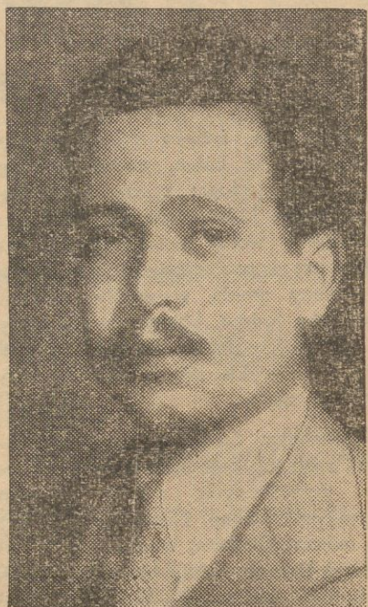
Nowy regent ks. Lichtenstein, 31-letni ksiądz Franciszek Józef. Obszar jego władztwa liczy zaledwie 159 km 2 powierzchni i 11.500 ludności.