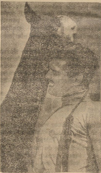
...i dlatego jego ulubiony koń, „Sunny”, ciągnie go za czuprynę.