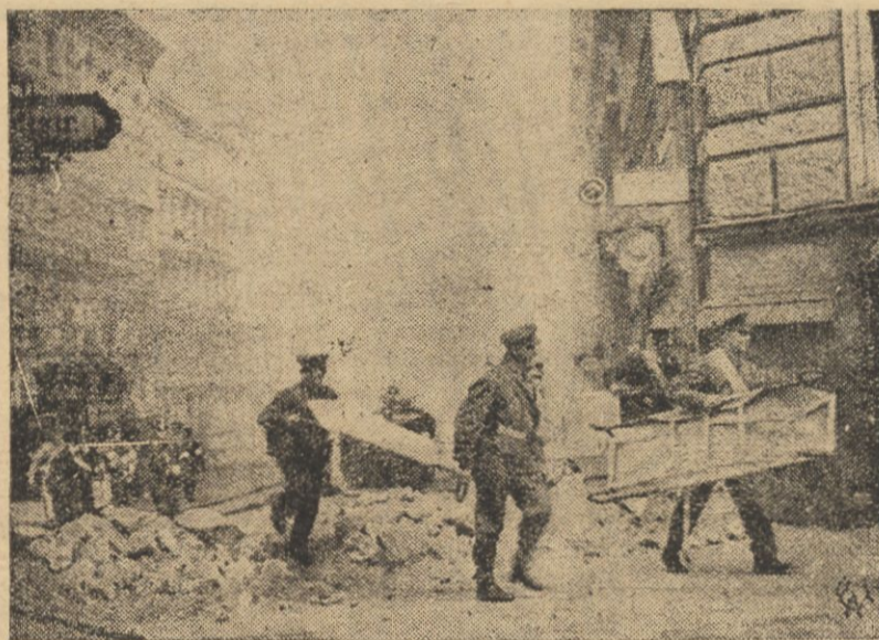
W Berlinie odbyła się na szeroką skalę zorganizowana próba obrony przeciwlotniczej i przeciwgazowej. Na zdjęciu — fragment akcji ratowniczej po ataku lotniczym.