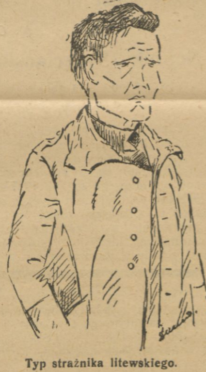
Typ strażnika litewskiego.