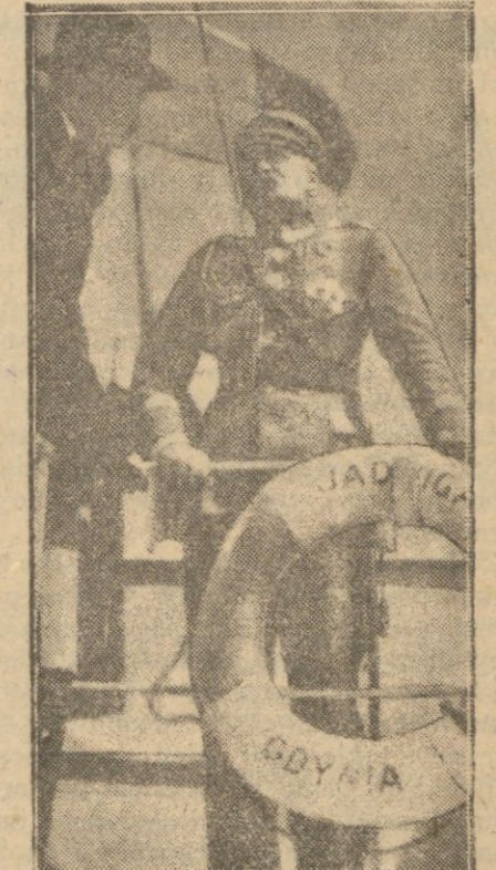
Z powodu podróży Pana Marszałka Piłsudskiego na kontrotopedowcu „Wicher”, podajemy fotografię z pobytu Pana Marszałka na pokładzie statku „Jadwiga”. Zdjęcie to zrobione było w porcie gdynskim przed dwoma laty.