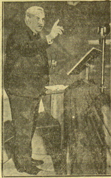
Links Reichsminister Dr. Dietrich, der Vorsitzende der Deutschen Staatspartei, bei einer Wahlrede in Berlin, in der er sich für die Wiederwahl Hindenburgs einsetzte. Rechts: Adolf Hitler hielt im Berliner Sportplatz die erste Kandidatenrede.

Mit der Faust auf die Altentafel schlagend, fragte Snowden, wie es komme, daß in dieser Zeit nie dagewesener Depression England in der Lage sei, seine Stellung auf den Märkten der Welt er-