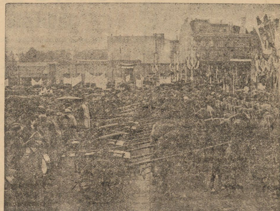
Moment uroczystego przekazania na placu Marszałka Piłsudskiego w Warszawie w dniu 7 maja br. sprzętu wojennego armii, ufundowanego przez robotników, przeszkolonych w Zjednoczeniu Polskich Związków Zawodowych.