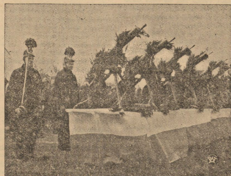
Moment przekazania wojsku ciężkich karabinów maszynowych, ręcznych karabinów maszynowych i granatów, zakupionych ze składek górników i szerokich warstw miejskiego społeczeństwa w Pietwałdzie na Śląsku Żaluziańskim. Widzimy ufundowaną przez górników broń, przybraną zielenią i kwiatami. Obok stoi warka honorowa górników.