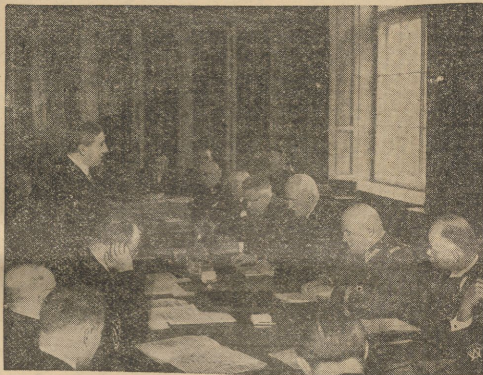
Fragment z posiedzenia kuratorium Chemicznego Instytutu Badawczego w obecności Pana Prezydenta Rzeczypospolitej Przemawia p. wicepremier inż. Kwiatkowski.