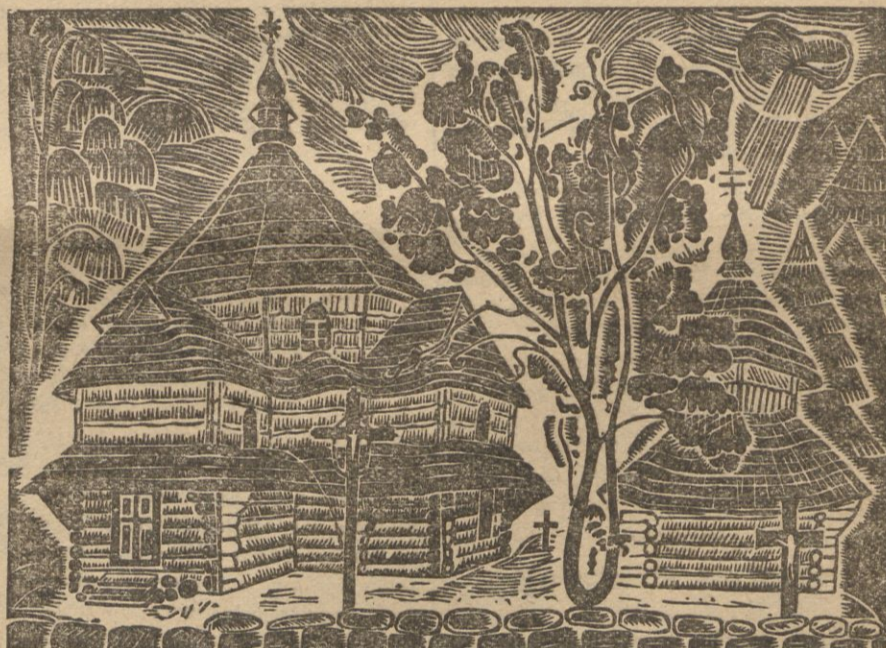
„STARA CERKIEWKA NA HUCULSZCZYŹNIE” OLGA ŻUKOWSKA Drzeworyt, 30x22. Cena 6 zł.

Zamówione obrazy będą odebrane w administracji pisma od dn. 10 bm. za opłaceniem należności. Na koszty ewentualnej przesyłki pocztowej należy dodatkowo przesłać 50 gr.