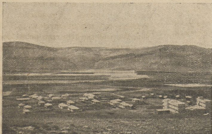
Na pierwszym planie kibuc Tel Josef: dwa wielkie bloki na prawo są domami dla dzieci. W kilkunastu małych mieszkają dorośli. — W dali góry Gilboa.

berg nie tylko uratował wiele nędzarskich kurn jak Gesser i wielu nędzarzy. — Jest w Polsce śliczna legenda o dobrej królowej Kindze, która z oczystych Węgier przeniosła cudem Polsce żupy solne Wieliczki. — Rutenberg swej odnalezionej ojczyźnie nie przeniósł żadnej z bogatych sztolni rosyjskich. Ale zamiast czarnej, dał im to, co się potocznie wśród techników określa „biały węgiel”. Ogromnie obcy sobie są ciemni kmięcie z górzyszczy gdzie Bochnia i sterani chaluze z Emeku. — Dystans między średniowieczną królową z dynastji, która prócz niej dała Bogu jedenastu świętych, a między żydowskim inżynierem z Rosji Pinkusem Rutenbergiem jest ogromny, jest przepastny. A jednak zdaje mi się, że jest na świecie siła, która nad tą przepaścią rozpina przeciw wszystkiemu jakiś jednoczący luk: — błogosławieństwo dobrego czynu.