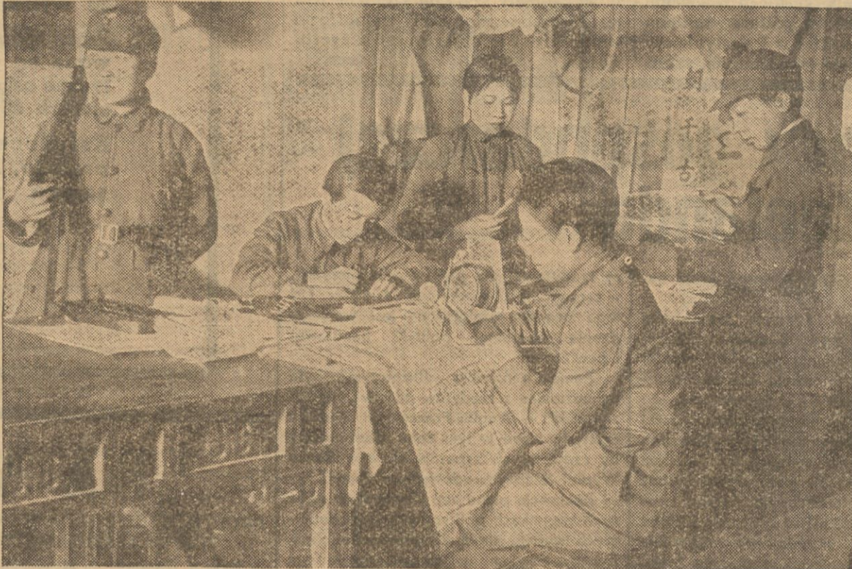
Chinki biorą w obecnej wojnie z Japonią bardzo czynny udział, w najrozmaitszych oddziałach, jak np. Czerwony Krzyż, czy nawet z karabinem w rękę w okopach. Na zdjęciu kwatery Chinek-żołnierzy.