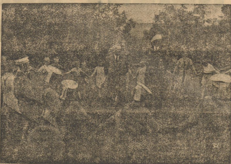
W czasie swego pobytu na Górnym Śląsku rumuński minister do spraw młodzieżowych T. Sidorowici zwiędził wraz z delegacją władz naczelnych organizacji „Strajka Taru” w towarzystwie prezesa Związku Harcerstwa Polskiego wojewoda Grażyński i go ważniejsze ośrodki przemysłowe, oraz śródmiejska harcerek. Nr zdjęcia — Pan minister Sidorowici i wojewoda Grażyński wśród młodzieży harcerskiej w Górkach.

impulsy powodują uruchomienie robota, trzy impulsy, np. „Elektro, proszę stanąć” — zatrzymują go, a cztery przywracają go do postawy spoczynkowej. Zresztą wyrazy mogą być dowolne; robot nie jest więc zbyt „inteligentny”. „Elektro” potrafi wykonać sprawnie 25 ruchów. Ośrodek, kierujący tymi ruchami, składający się z czterdziestu kilku obwodów, mikrofonu i komórki elektrycznej — waży ok. 25 kg. Dla wykonania 500 najbardziej podstawowych ruchów ludzkich robot musiałby być więc zaopatrzony w ośrodek — swojego rodzaju mózg — ważący 500 kg. Reagowanie na barwy oparte jest na dość prostym urządzeniu, składającym się z filtrów barwnych, komórek fotoelektrycznych i amplitifikatorów, połączonych z taśmami dźwiękowymi. Zastosowano pomysłowe urządzenie, podnoszące niezwykle efekt słów „wymawianych” przez nowego robota: głośnik radiowo reprodukuje dźwięk sprężonego z aparaturą elektromagnetyczną, poruszającą usta w ten sposób, że głośniejszy dźwięk powoduje większe rozchylenie warg.