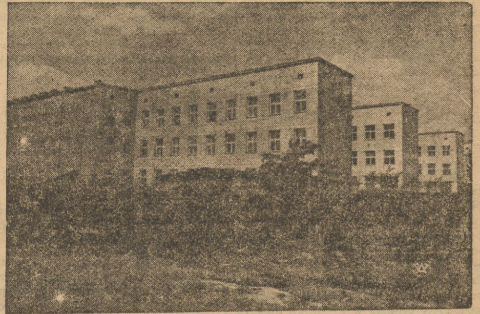
Rzut oka na nowy gmach chemii U. J. P.

Natomiast prace laboratoryjne odbywają się już w nowej siedzibie zakładu.