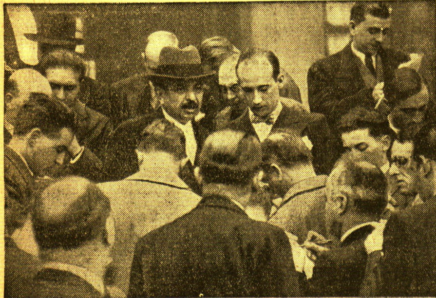
Laval vor der Presse

Nach einwöchiger außerordentlich gefährlicher Regierungskrise ist es dem französischen Außenminister Laval noch gelungen, ein neues Kabinett zu bilden, mit dem er sich noch am letzten Freitag als Ministerpräsident und Außenminister der Kammer vorstellte. Unter Bild zeigt Laval während seiner Erklärungen an die Pressevertreter, nachdem ihm der französische Staatspräsident zum zweiten Male den Auftrag zur Regierungsbildung gegeben hatte.