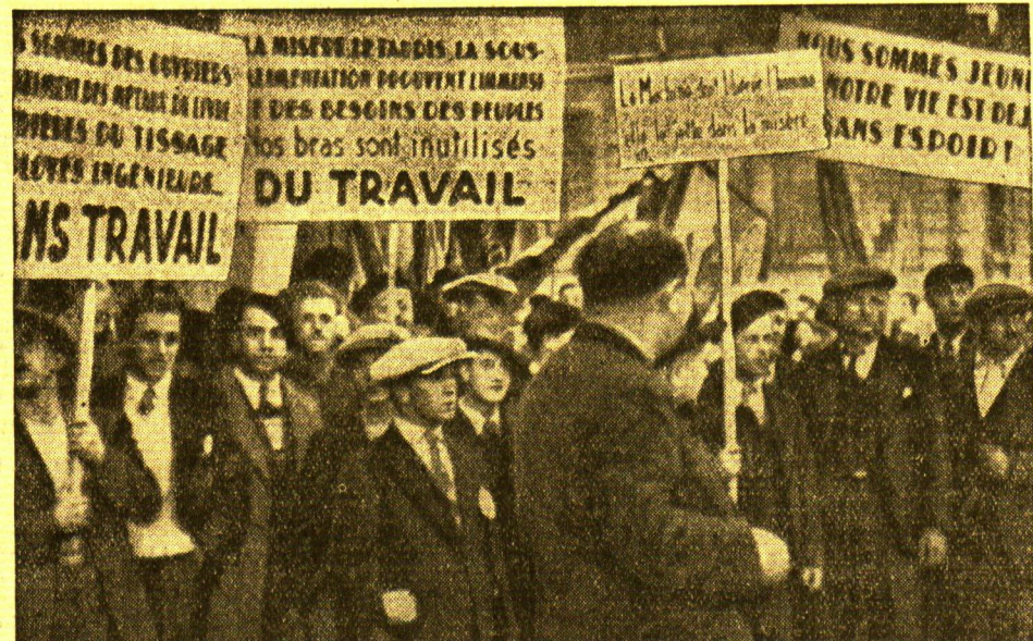
Die Jugend der Länder klagt an...

Der bisherige Indien-Minister des Kabinetts Macdonald, Sir Samuel Hoare, wurde Außenminister in der neuen Regierung Baldwins.