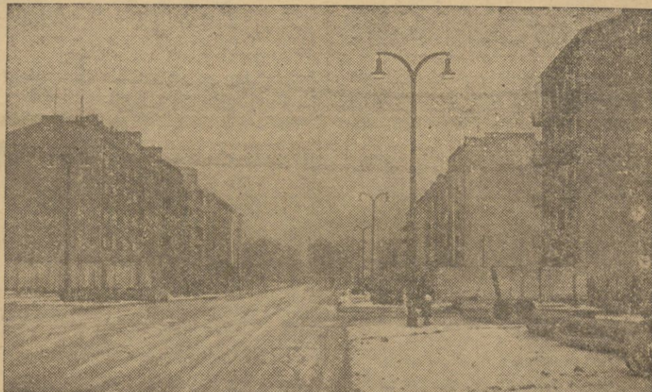
Rzut oka na Aleję Niepodległości w Warszawie, która będzie stanowiła centrum dzielnicy reprezentacyjnej Marszałka Piłsudskiego. Prace dookoła stworzenia tej dzielnicy posuwają się w szybkim tempie naprzód.