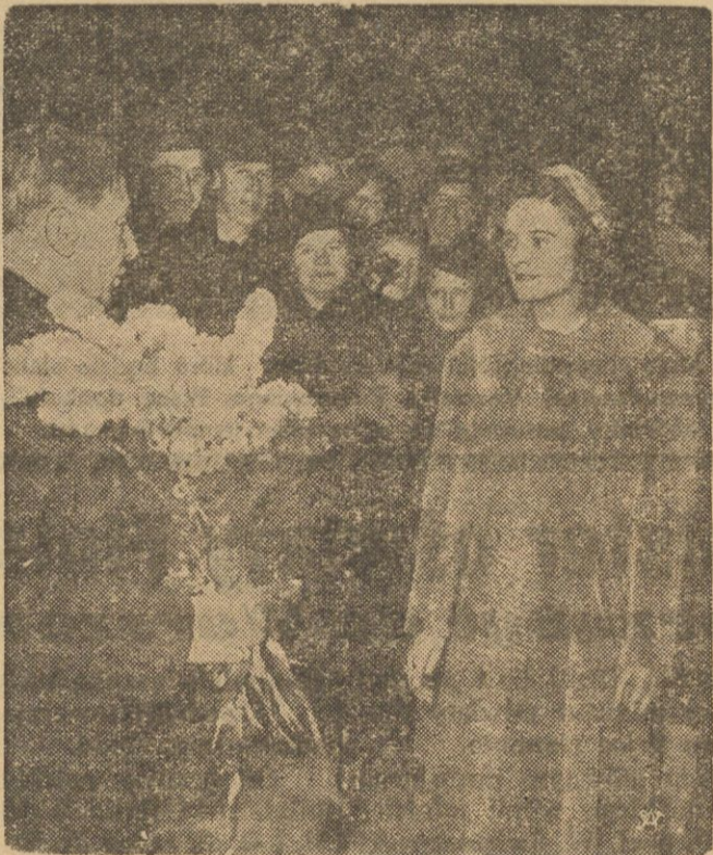
Na zdjęciu moment składania gratulacji, oraz wręczania zdobytych nagród, nowo-kreowanej łyżwiarce i mistrzyni świata p. Megan Taylor, w Pałacu Sportowym w Sztokholmie.