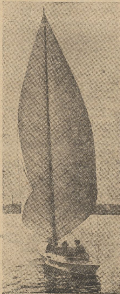
Pierwsza jaskółka sezonu żeglarskiego.