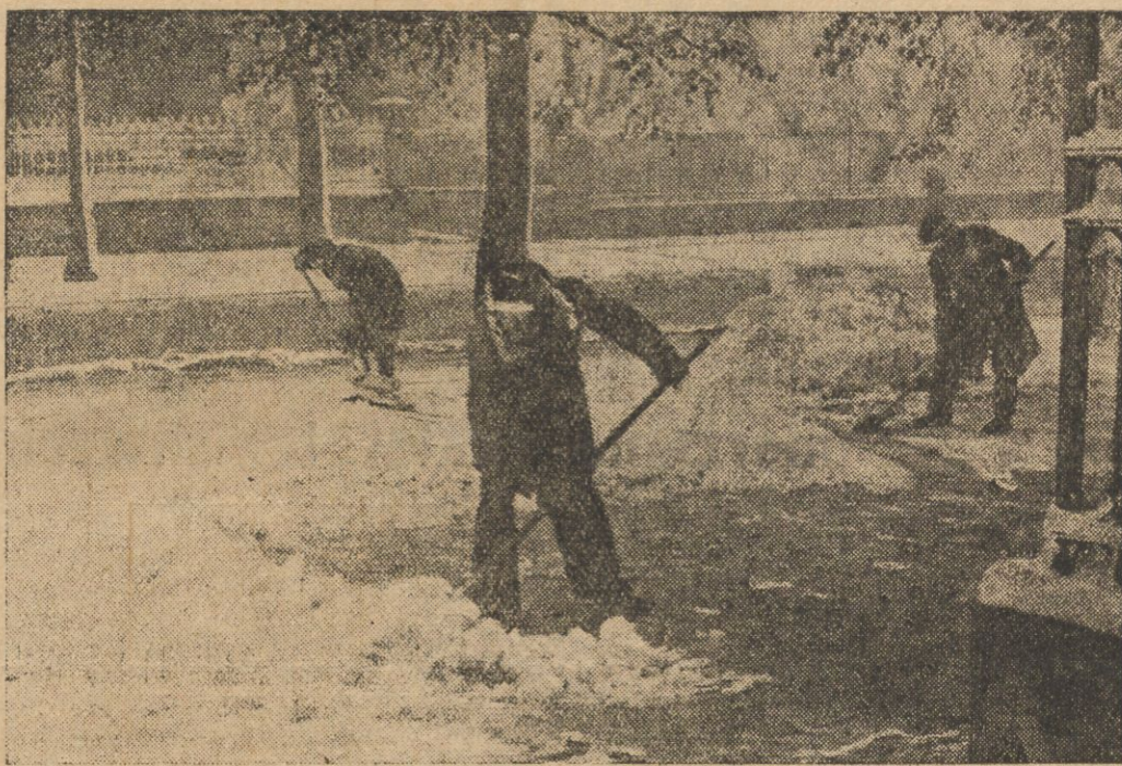
Tak we czwartek wyglądały Al. Ujazdowskie w Warszawie.