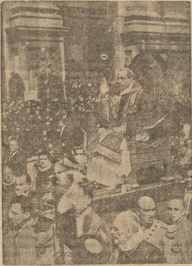
Ojciec Święty Pius XII w momencie udzielania błogosławieństwa apostolskiego, podczas uroczystości objęcia we władanie Papieża Bazyliki Laterańskiej w Rzymie.