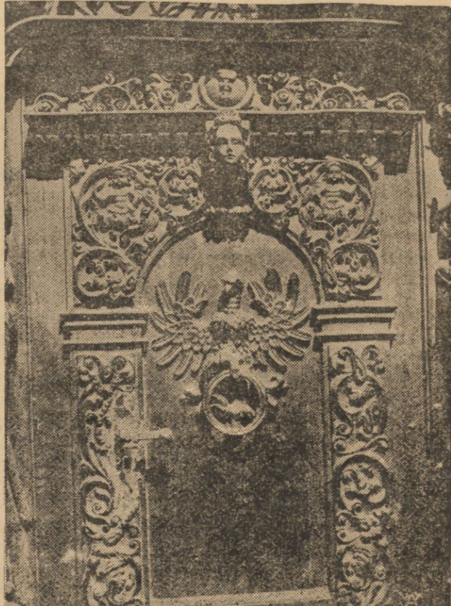
Drzwi wejściowe do t. zw. Sieni Gdańskiej w Dworcu Artusa, z rzeźbą orła polskiego, usuniętego w r. ub. przez czynniki gdańskie.