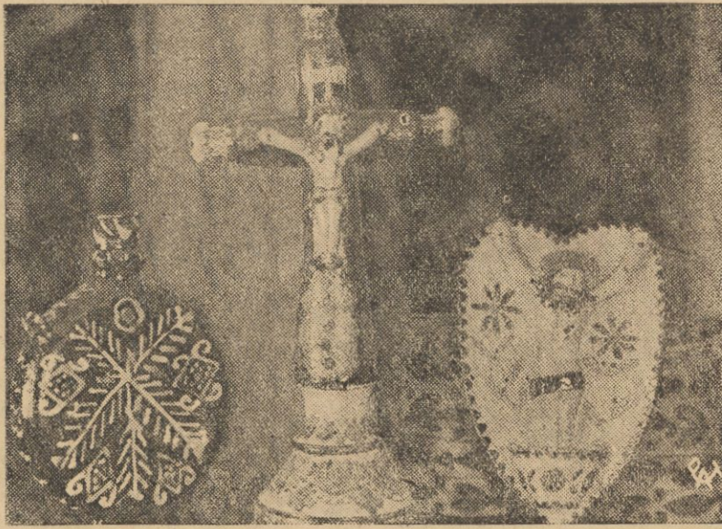
Piękne okazy huculskiego przemysłu ludowego: cutra — gliniana butelka do wody, krucyfiks i kropielnica z charakterystyczną ornamentyką.