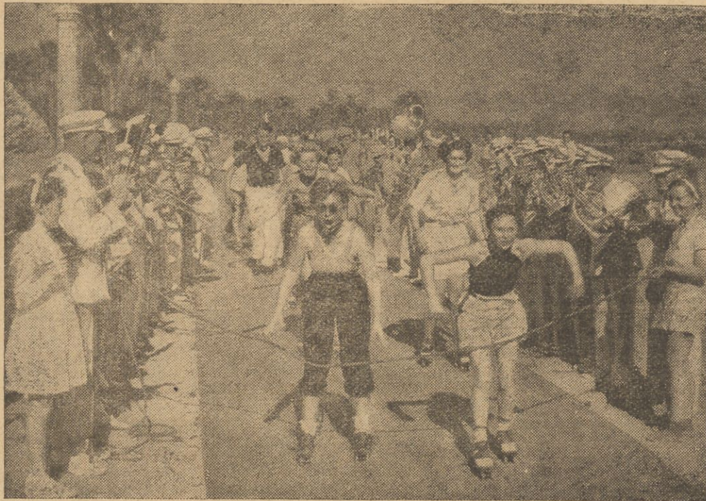
Ponownie coraz więcej rozpowszechnia się sport jazdy na wrotkach. Ostatnio na zawodach wrotkowych w Santa Barbara w Kalifornii zwyciężyła kobieta — studentka, który widzimy na ilustracji w czasie startu (na prawo).