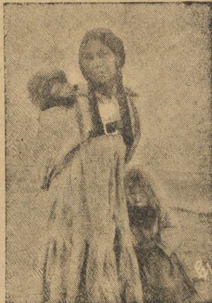
W dniu 6 b. m. wyjechał z Gdyni do Ameryki, jakoteż w kołach geograficznych amerykańskich letnich wyrusza na wyspę Kościuszki (w pobliżu Alaski), gdzie z ramienia Instytutu Geograficznego U. J. przeprowadzi badania naukowe. Na zdjęciu — typy eskimoskie z Alaski w-g zdjęć z poprzedniej wyprawy dr. Jarosza: a) Rodzina dzieci eskimoskich z nad cieśniny Beringa.