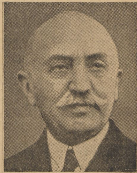
Premjer Grecji Tsaldaris

RZYM, (PAT). — W związku z wypadkami w Grecji odpłynęły na morze Egejskie: krążownik „Tranto“ i kontrtorpedowce „Damosto“ i „Pigafetta“. Okręty te zatrzymają się narazie w Dodekanezie.