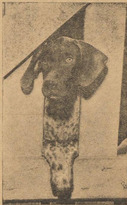
Pan poszedł na polowanie sam...