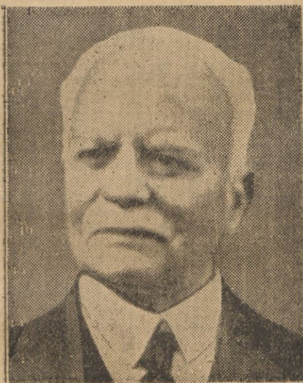
Prezydent Grecji Zaimis

do wojska. W danym razie wezwano jedynie do koszar żołnierzy poprzednio urlopowanych na zimę ze względów oszczędnościowych. Wezwanie to motywowane jest koniecznością skompletowania kadr wewnątrz kraju, wobec tego, że nie które oddziały skierowano dla wzmocnienia ochrony na granicy grecką.