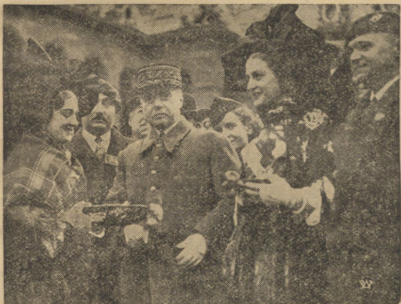
W Paryżu było uroczyste obchodzone święto braterstwa broni dawnych francuskich dywizji alpejskich z czasów wojny światowej, zorganizowane przez Związek b. Kombatantów. Zdjęcie przedstawia fragment z uroczystości na dziedzińcu przed Pałacem Inwalidów. Dziewczęta francuskie w strojach alpejskich wręczają kwiaty szefowi sztabu generalnego gen. Gamelin.