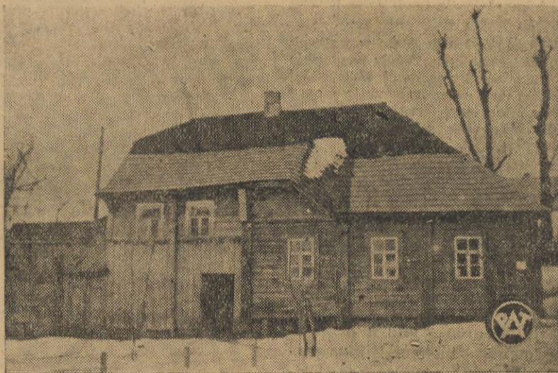
Piękny okaz polskiego zabytku budownictwa drewnianego — szkoła żydowska w Nowogródku o oryginalnej konstrukcji dachu.

WARSZAWA. (Pat). Berlin 213.45 — 13.98 — 12.92; Londyn 26.23 — 30 — 16; N. York 531 i pół; 32 3/4 — 30 1/4; N. York kabel 5.31 5/8 — 32 7/8 — 30 3/8; Paryż 35.00 i pół — 5.07 i pół — 493 i pół; Szwajcaria 17205 — 239 — 171.