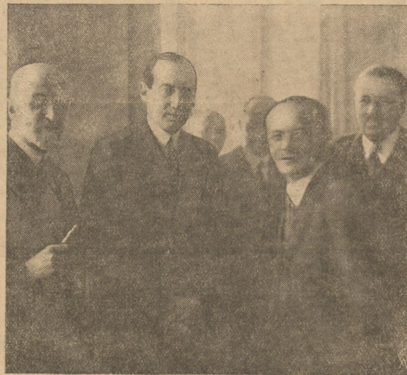
P. minister spraw zagranicznych Józef Beck wygłosił w komisji sejmowej do spraw zagranicznych obszerną exposé o aktualnej sytuacji międzynarodowej. Na zdjęciu naszym widzimy p. ministra Becka w chwili po wygłoszeniu przez niego exposé. Po lewej ręce p. ministra stoł prezesa klubu parlamentarnego BBWR p. Stanisław Stawek, po prawej p. marszałek Sejmu Świątlicki i p. wiceminister spraw zagranicznych Szebek.

Polska Zbrojna (46) porusza wciąż jeszcze nierozstrzygniętą sprawę umundurowania wojska polskiego w czasie pokoju.