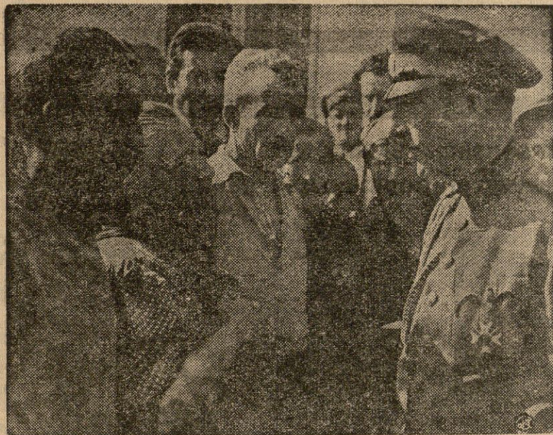
Król bułgarski Borys udał się na tereny, nawiedzone powodzią, w okolice miasta Sevlievo, gdzie w bezpośredniej rozmowie z powodziarzami starał się ich pocieszyć oraz udzielił zapomóg. Na zdjęciu — król Borys wśród ofiar powodzi.

Nie marnuj odpadków żelaznych gdyż są one potrzebne dla obrony Państwa!