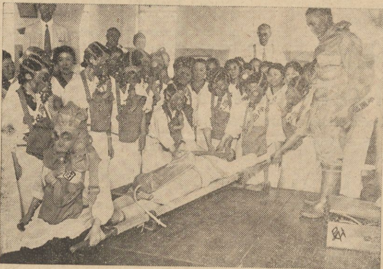
Członkinie japońskiego stowarzyszenia patriotycznego odbywają w szpitalu wojskowym w