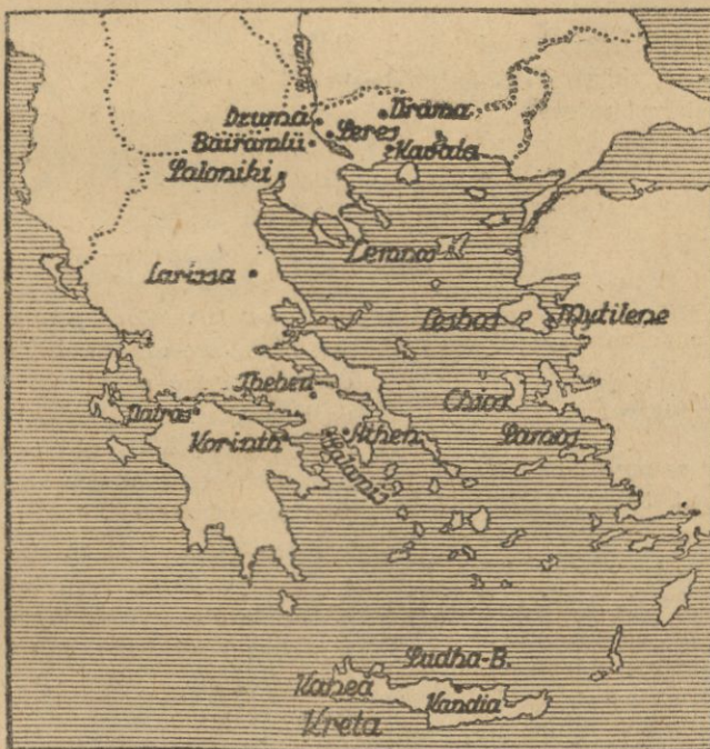
Mapka półwyspu bałkańskiego, orjentująca w położeniu i granicach Grecji, Turcji, Bułgarii, i Albanji

RYGA, (PAT). — Z Kowna donoszą, że wskutek nagłego tania lodów Niemen wystąpił z brzegów w okręgu Szawel. Poziom wynosił 150 cm. — 50 osób zatono.