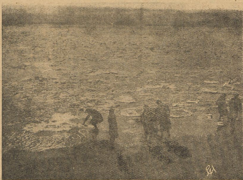
Kra na Wiśle pod Warszawą