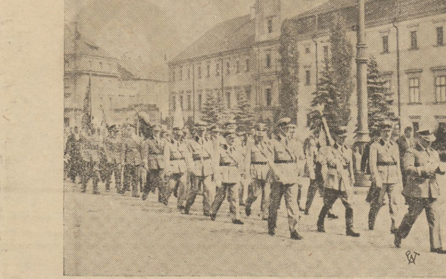
W ub. niedzielę odbyło się w Warszawie uroczyste poświęcenie sztandaru Związku Obrony Kresów Wschodnich. Na zdjęciu przemarsz oddziałów Związku z katedry św. Jana, gdzie odbyło się uroczyste nabożeństwo, na plac Józefa Piłsudskiego.