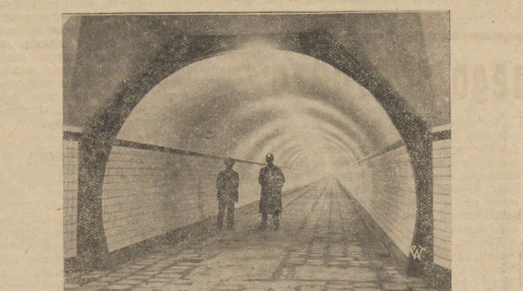
Gigantyczne twory techniki współczesnej — tunele pod rzeką Skaldą w Belgji. Jeden z nich długości 500 m. przeznaczony jest dla ryb, drugi, długości 2 km. dla ruchu L. kolowego. Otwarcie tunelu nastąpi 10 września r.b.