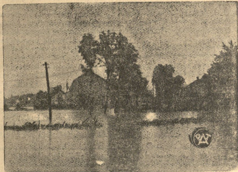
Wskutek wylewu rzek Odry, Olzy i Strugi Nowy Bogumina nawieziła klęska powodzi. Wody w dalszym ciągu przybierają. Zdjęcia — fragment z powodzi w okolicy Nowego Bogumina.