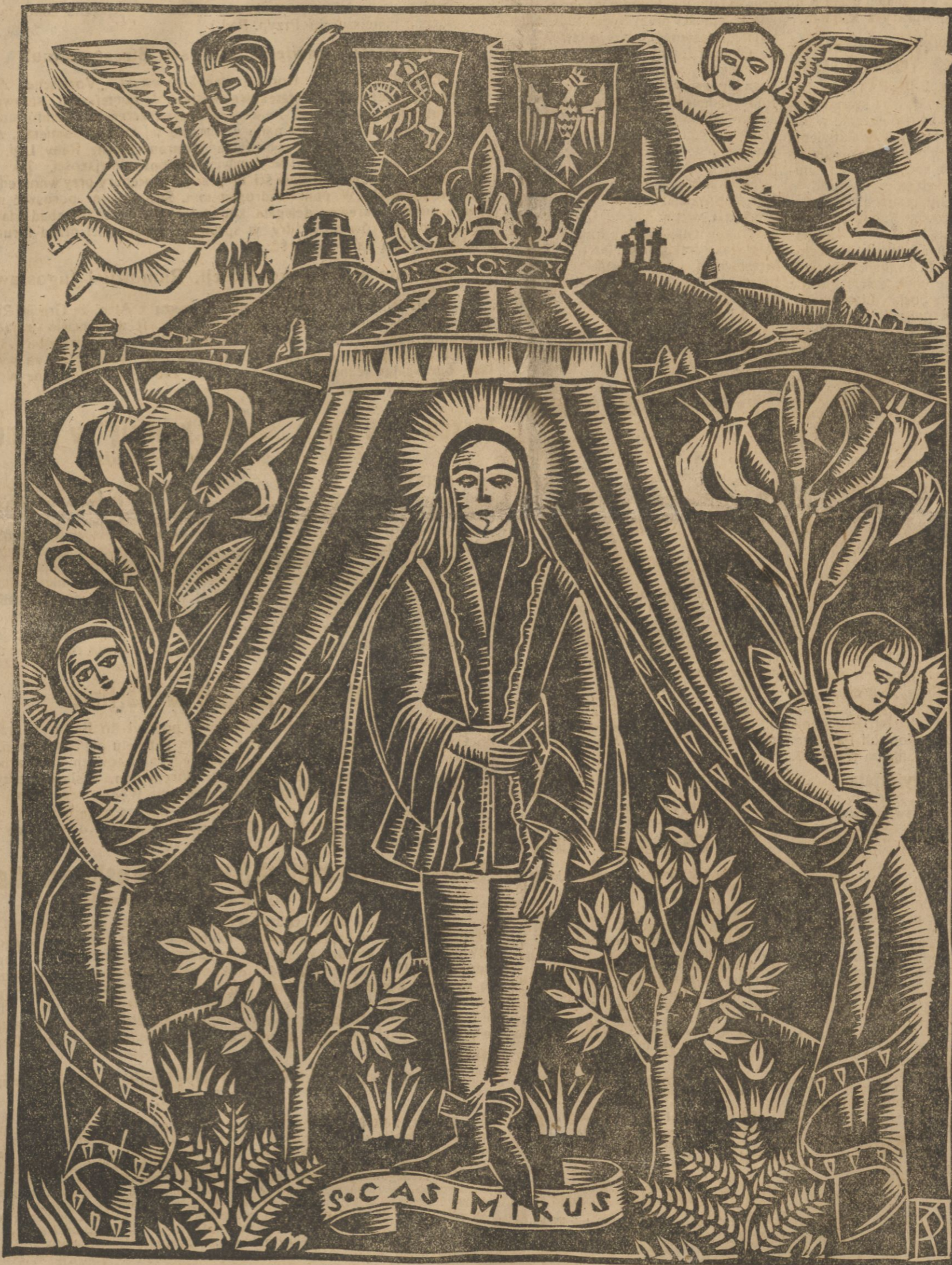
Linoleoryt Kazimierzy Adamskiej-Rouba.

Rok po roku niech się pamięć o tych zdarzeniach w umysłach naszych utrwała a w sercach cześć i miłość niech rosną dla wielkiego Patrona naszego, z pod którego opieki, zgodnej z niezbadanymi zamierzeniami Opatrzności, wyjść nie mogą ziemie zarówno Korony Polskiej, jak Wielkiego Księstwa Litewskiego, choćby się rozsypywały miłą, jak paciorki różańca, przybierając coraz to inną konfigurację. Sprawami ich i losami kierują siły, których istnienie tylko niezbitnie przeczuwać możemy, świadome celów i zamierzeń, których nie objąć i nie przewidzieć ludzkim rozumem. Jac.