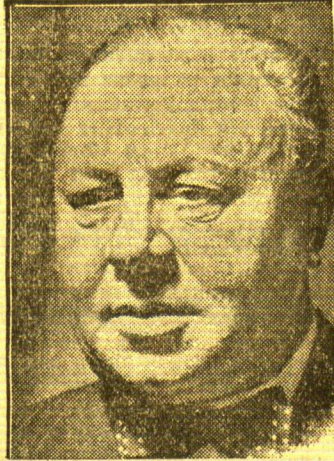
Emil Jannings in den Reichskulturkammer

Zimmer enger schließt sich der Ring der spanischen Nationaltruppen um Madrid, immer erbitterter wird auf beiden Seiten gekämpft. Links: Ein Maschinengewehrnest der Franco-Truppen im Casa de Campo, westlich der Stadt, deren Häuser im Hintergrund deutlich erkennbar sind. — Rechts: Nationale Stoßtruppe marschieren unter der Fahne der Freiheit, wie unser Bild zeigt, nach Madrid.