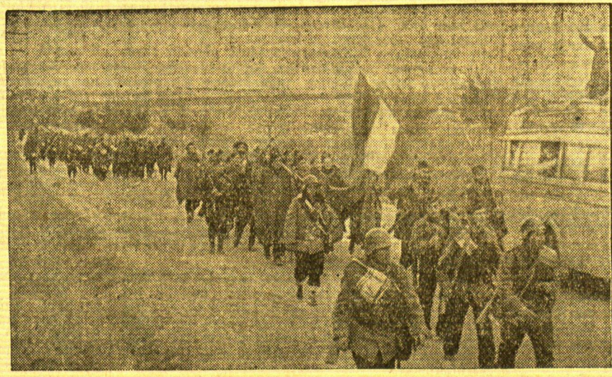
Franco's Truppen an der Stadtgrenze von Madrid

Zimmer enger schließt sich der Ring der spanischen Nationaltruppen um Madrid, immer erbitterter wird auf beiden Seiten gekämpft. Links: Ein Maschinengewehrnest der Franco-Truppen im Casa de Campo, westlich der Stadt, deren Häuser im Hintergrund deutlich erkennbar sind. — Rechts: Nationale Stoßtruppe marschieren unter der Fahne der Freiheit, wie unser Bild zeigt, nach Madrid.