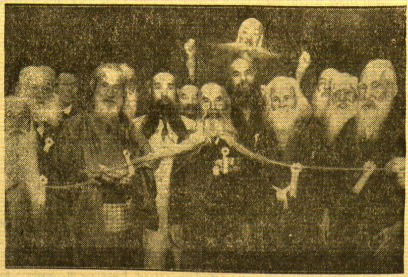
Der hat aber einen Bart!

Präsident Roosevelt auf dem USA-Kriegsschiff „Indianapolis“ auf dem Wege zur Panamerikanischen Friedenskonferenz in Buenos Aires. Neben Präsident Roosevelt, in Zivil, sein Sohn.