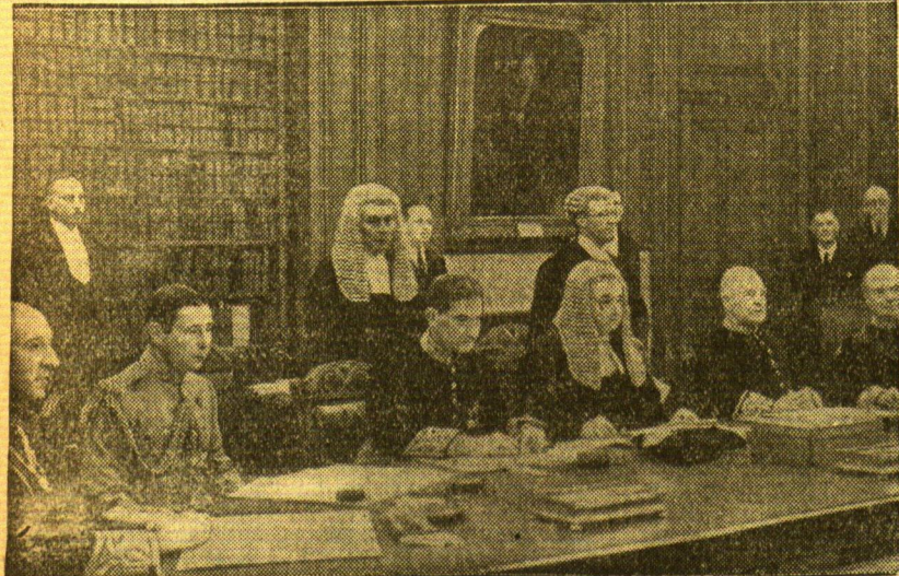
Der älteste Gerichtshof der Welt