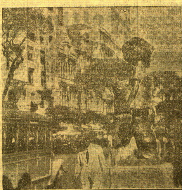
Das Denkmal der Zeitungsjungen auf der Prunkstraße von Rio de Janeiro