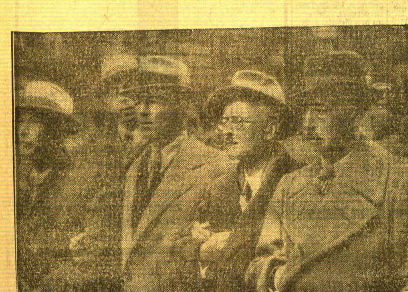
Arm in Arm . . .

Oslo, 30. November. Die norwegische Regierung hat ein Verbot erlassen, Waffen, Munition oder Flugzeuge auf norwegischen Fahrzeugen nach Spanien zu verschiffen. Die Verordnung tritt sofort in Kraft.