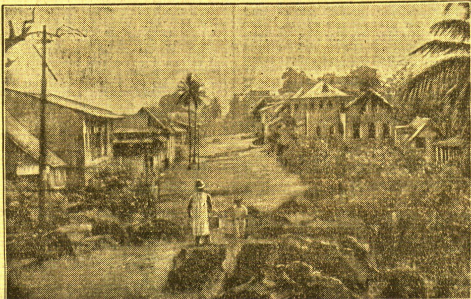
Die „Front-Street“ in Monrovia

Die Gummipflanzung ist ein Staat im Staate Liberia. Liberia darf auf dem Gebiet der Pflanzung keine Steuern erheben. Firestone kann alles Material, das dem Unterhalt und der Vergrößerung der Plantage dient, zollfrei importieren. Amerikanische Berater überwachen Ausgaben und Einnahmen der liberianischen Regierung und legen den Beamten scharf auf die Finger. Wird fortgesetzt.