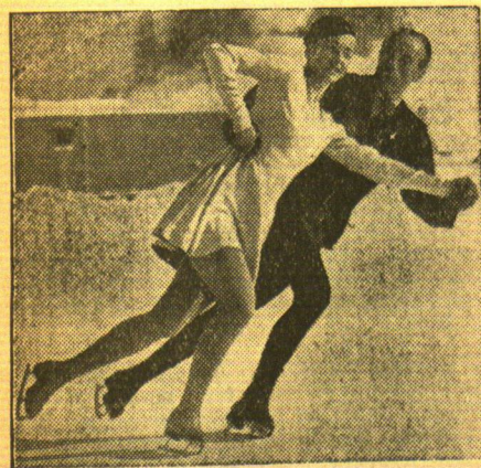
Herber-Baier nun auch Weltmeister

Die Kämpfe um die Eiskunstlauf-Weltmeisterschaft in Paris endeten mit einem Erfolg des deutschen Paares Magt Herber und Ernst Baier, die einstimmig zu Weltmeistern erklärt wurden.