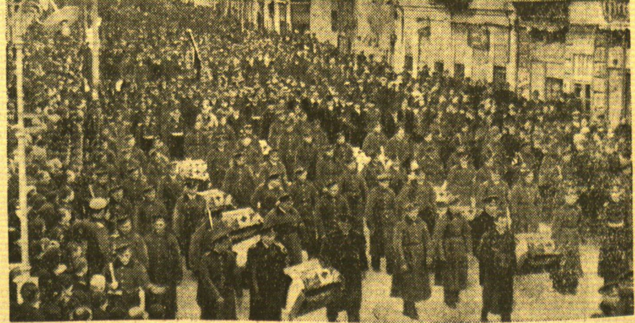
Feierliche Beisetzung deutscher U-Boot-Helden in Bulgarien