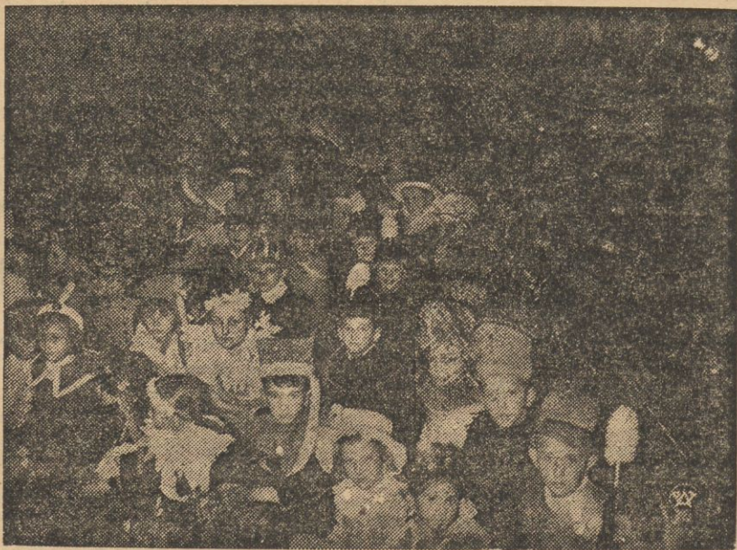
Fragment z dziecięcej zabawy choinkowej, urządzonej dnia 6 grudnia w sali Rady Miejskiej w Warszawie dla dzieci