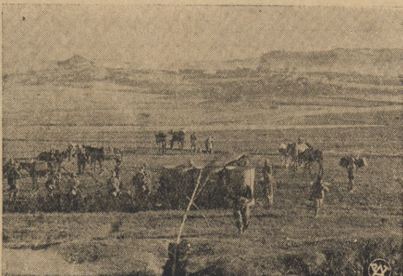
Pojenie mułów w Adigracie.

Wiadomości na ten temat są z gruntu fałszywe. W Polsce niema ograniczeń dewizowych, są tylko ograniczenia w wydawaniu paszportów zagranicznych, podyktowane koniecznością ograniczenia wydatków, związanych z podróżami zagranicznymi.