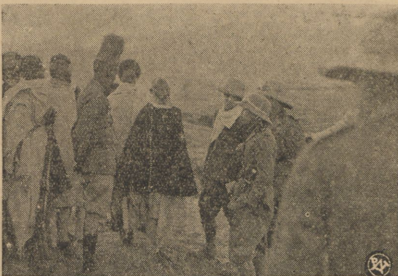
Wódz abisyński, który przybył do obozu włoskiego poddać się, w rozmowie z oficerami i żołnierzami. Jak wiemy, w dniach ostatnich sytuacja na froncie wojennym zmieniła się nieco i Włosi, którzy przez szereg tygodni zwyciężali bezapelacyjnie zaczynają ponosić pierwsze poważne porażki.