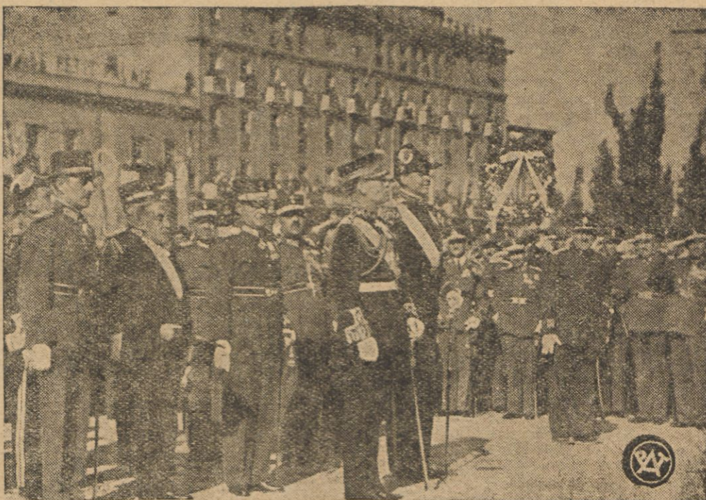
Król grecki Jerzy II-gi w towarzystwie następcy tronu Pawła po złożeniu wieńca na grobie Nleżnanego Żołnierza w dniu swego powrotu do Aten.