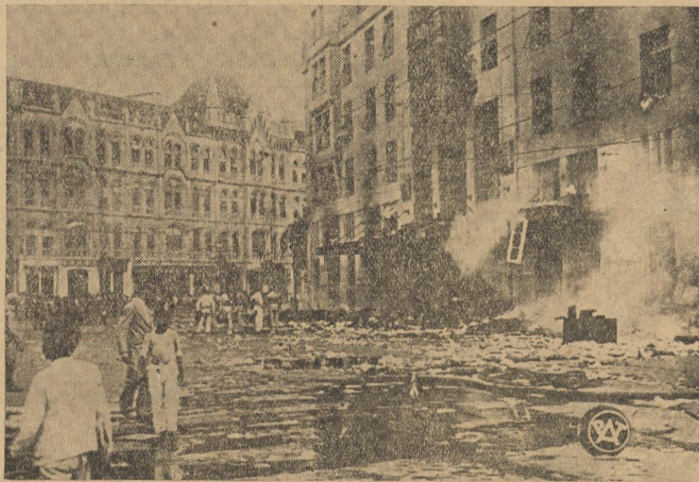
Przez parę ostatnich dni północne Stany Brazylii były widownią krwawych rozruchów komunistycznych, w które przerodził się bunt kilku oddziałów wojskowych. Rząd zmobilizował wiernie sobie siły wojskowe, parę krążowników, oraz przy pomocy artylerji opanował sytuację, niemniej jednak straty w ludziach w ciągu kilkudniowych zamieszek są bardzo znaczne. Na zdjęciu — redakcja dziennika „A Noite“ w Rio de Janeiro podpalona przez sympatyków rewolty.

Tak powiedział Marszałek w swej pamiętnej mowie w Lublinie, w styczniu r. 1920.