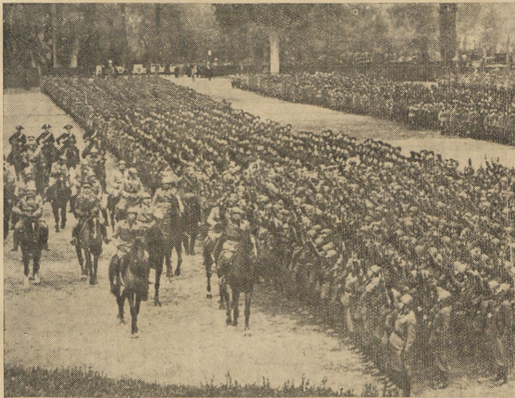
Dwunastolecie milicji faszystowskiej obchodzą w Rzymie z wielką uroczystością w obecności Mussoliniego. W paradyzie brały również udział różne oddziały wojska.