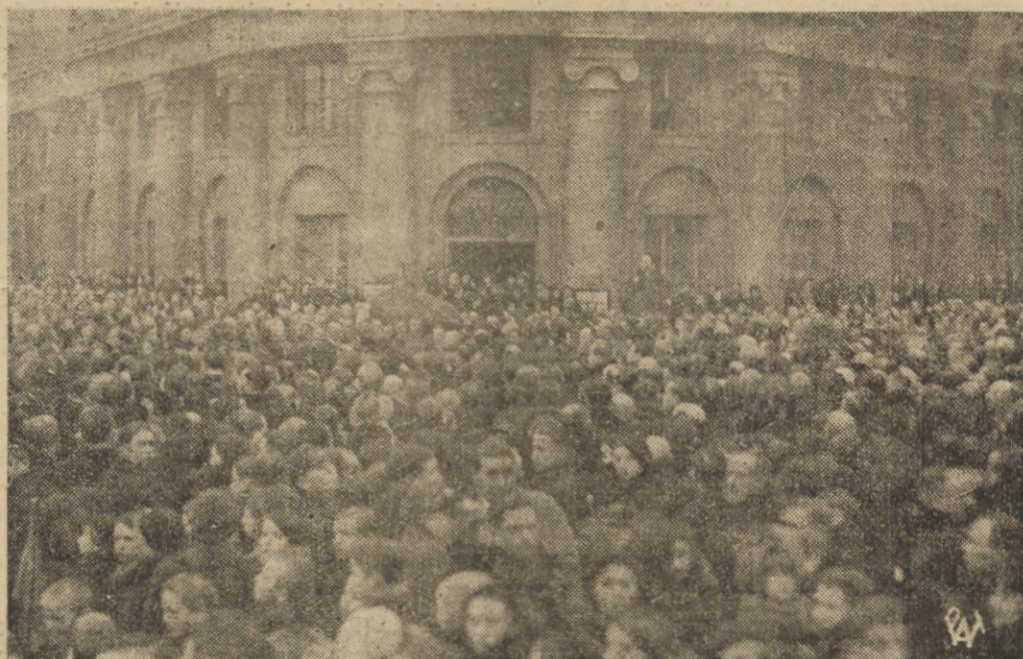
W ub. wtorek odbył się w Warszawie pogrzeb ś. p. senatora Bolesława Limanowskiego, nestora bojowników o niepodległość. Na zdjęciu — moment wynoszenia trumny z gmachu Związku Zawodowego Kolejarzy.