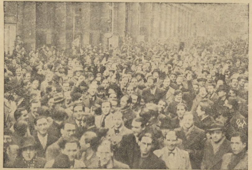
W Paryżu doszło w tych dniach do strajku studentów wydziału medycznego tamtejszego Uniwersytetu, na tle ograniczenia praw studentów cudzoziemców. Na zdjęciu — demonstracja studentów przed gmachem wydziału lekarskiego.