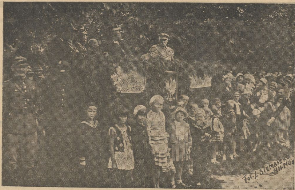
Marszałek Piłsudski przyjmuje defiladę.

BERN, 8. 8. (Pat). Lot w stratosferę prof. Piccarda odbędzie się przy końcu przyszłego tygodnia.