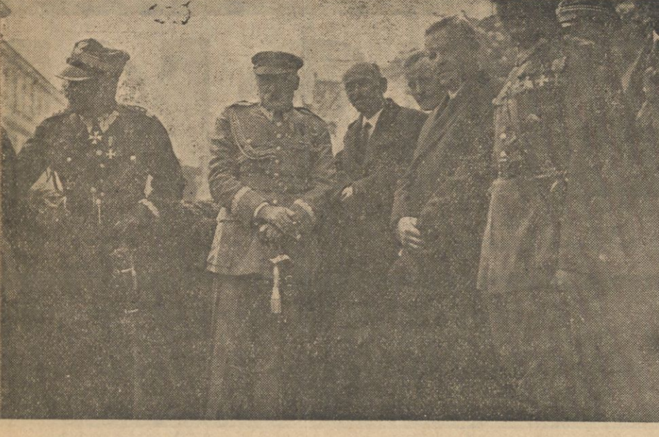
Marszałek Piłsudski na trybunie w otoczeniu przedstawicieli władz cywilnych, wojskowych i samorządowych.

skiej Nr. 3 od dnia 9 b. m. do 11 b. m. w godzinach od 10 do 14 i od 17 do 20. Informacji udziela się również telefonem Nr. 17-52. Sekretariat Związku przy ulicy Bernardyńskiej Nr. 10 m. 1 w czasie organizacji Zjazdu t. j. od 9 b. m. do 11 b. m. nie będzie urzędował, nowych zgłoszeń absolutnie nie przyjmuje się.