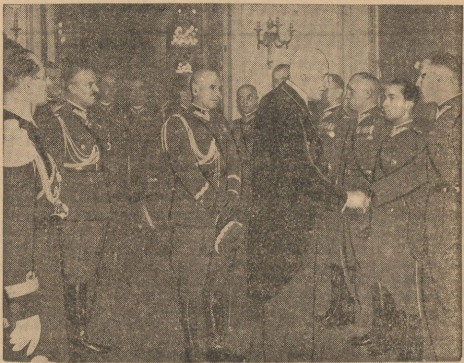
Pan Prezydent Rzeczypospolitej wita się z najmłodszymi podporucznikami armii polskiej. Obok Pana Prezydenta R. P. Naczelnny Wódz P. Marsz. Rydz-Śmigły.

Nowopromowani podporucznicy u Pana Prezydenta R. P.