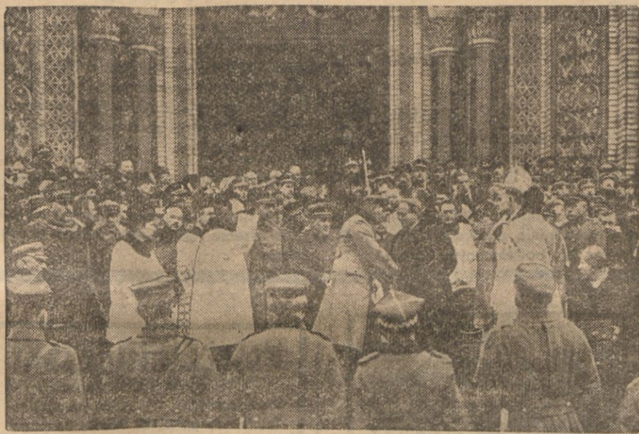
Marszałek Piłsudski wita się z Nuncjuszem Cortesim, obecnym Ojcem św. Piusem XIII.