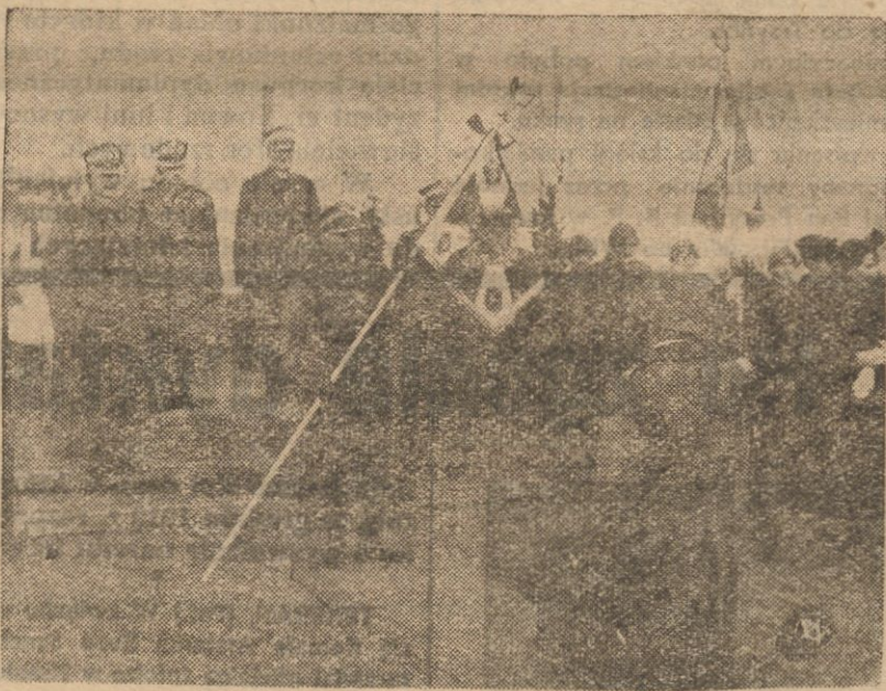
Moment uroczystego wręczenia szandarów dowódcom pułków artylerii przeciwlotniczej przez pana ministra Spraw Wojskowych gen. Kasprzyckiego.

borców miało się dopiero ujawnić w całej jaskrawości w Wolnej Polsce. Pod obcym panowaniem jakże ulankowy udział brało społeczeństwo polskie w budowie szkół polskich, w rozbudowie przemysłu i komunikacji, w regulowaniu dróg wodnych w wyszkanianiu bogactw naturalnych ziemi, w tworzeniu instytucji społecznych, opiekuńczych i zdrowotnych, w procesie reform finansowych i agrarnych, w procesie rozbudowy miast — jedynym regulatorem tych codziennie narastających niedoli ludzkich na ziemiach polskich, niedoli, nie wywołujących zbyteknie trosk u rządów zaborczych — była emigracja najdzielniejszych, najwartościowszych jednostek za granicę i często za morze.