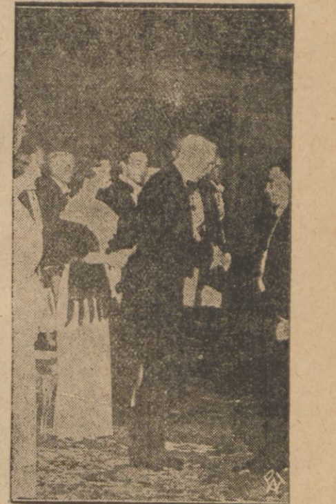
W Sztokholmie odbyła się uroczystość wręczenia przyznanych w tym roku nagród Nobla. Wręczenia dokonał osobiście król Gustaw.

Wielki tłum przyszedł do sklepu w którym pracowałem. Pierwszą myśl, jaka na widok tych biedaków przyszła do głowy to — że trzeba się nimi zaopiekować, żeby przynajmniej głodu nie cierpieli. Sprawę tą zajęła się drobna, wte dy z samych jeżesze handlowców złożona, grupa t. zw. oświatowców.