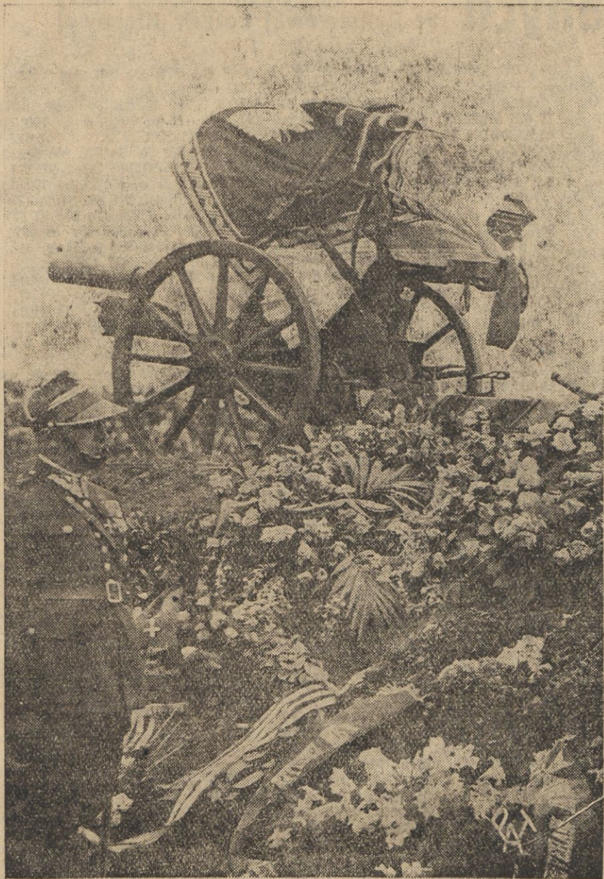
Na polu Mokotowskim w miejscu, gdzie Marszałek zwykł przyjmować defiladę, stanęła Jego trumna wśród kwiatów

„Sztandary nasze, okryte chwałą zwycięstw, mogą schylać czoło jedynie przed reprezentantem państwa i przed tymi, co wojskiem dowodzą“.