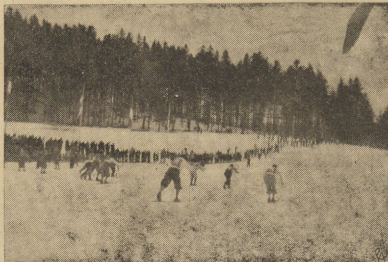
W Szczyrbskim Plesie w Czechosłowacji odbywają się obecnie międzynarodowe mistrzostwa narciarskie F. I. S. Na zdjęciu — start do narciarskiego biegu sztafetowego 4 razy 10 klm