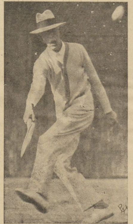
W ramach międzynarodowego turnieju tenisowego w Nicei weźmie udział król Gustaw szwedzki, startujący zwykle pod pseudonimem Mr. G. Na zdjęciu król Gusaw podczas treningu w Nicei