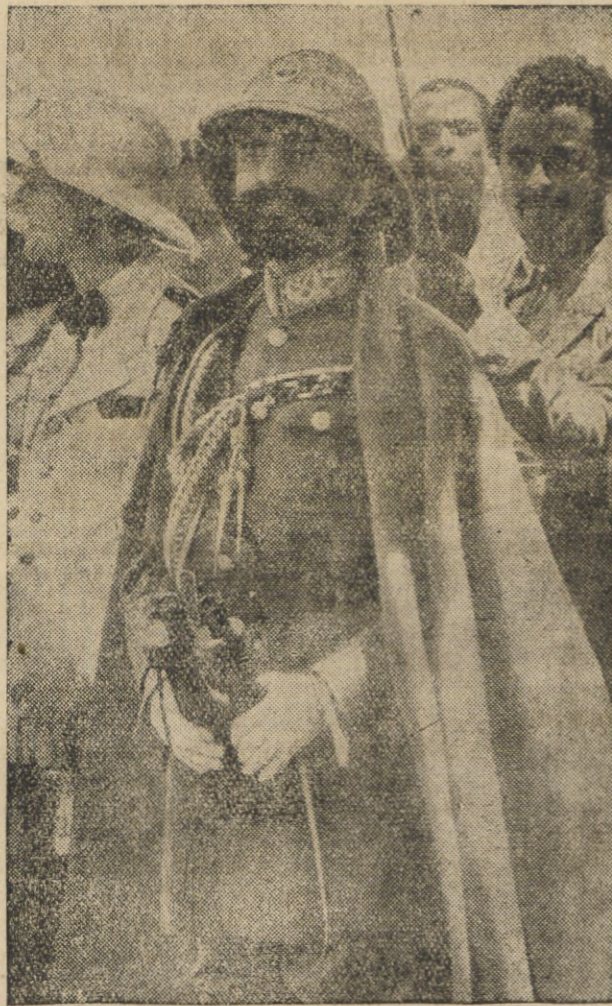
Cesarz Abisynji w mundurze feldmarszałka

LONDYN (Pat). O powadze sytuacji międzynarodowej na tle zatargu włosko-abisyńskiego świadczy fakt, że urzędnicy Foreign Office nie otrzymują urlopów, a bawiących na wypoczynku wzywano do powrotu. W izbie lordów odbędzie się we wtorek dyskusja nad sprawą abisyńską.