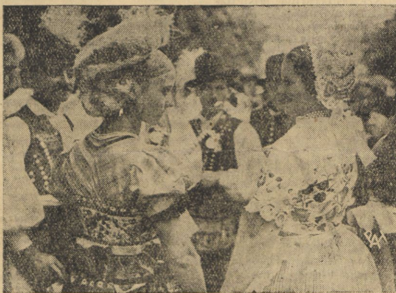
Jak wiadomo, w Londynie odbywa się obecnie wielki międzynarodowy kongres tańca ludowego. Zdjęcie nasze przedstawia grupę węgierską w oryginalnych kostiumach ludowych.