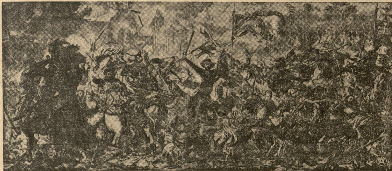
W związku ze zbliżającą się 529 rocznicą oręża polskiego nad wojskami krzyżackimi pod Grunwaldem i Tanenbergiem, reproduujemy jedno z arcydzieł malarstwa polskiego, mianowicie słynny obraz Jana Matejki „Bitwa pod Grunwaldem“.