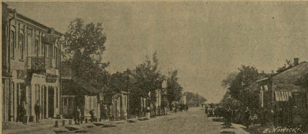
Ulica „Szyrokaja“ u Slucku.