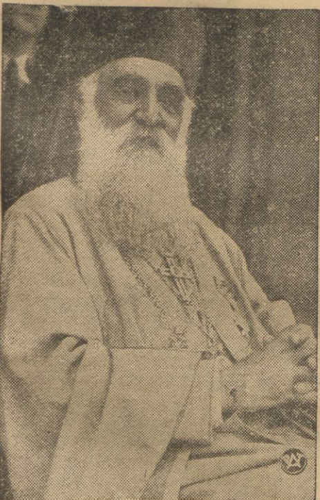
Nowy premier rumuński patriarcha Miron.

Podniesienie poziomu moralnego. Nacionalizm