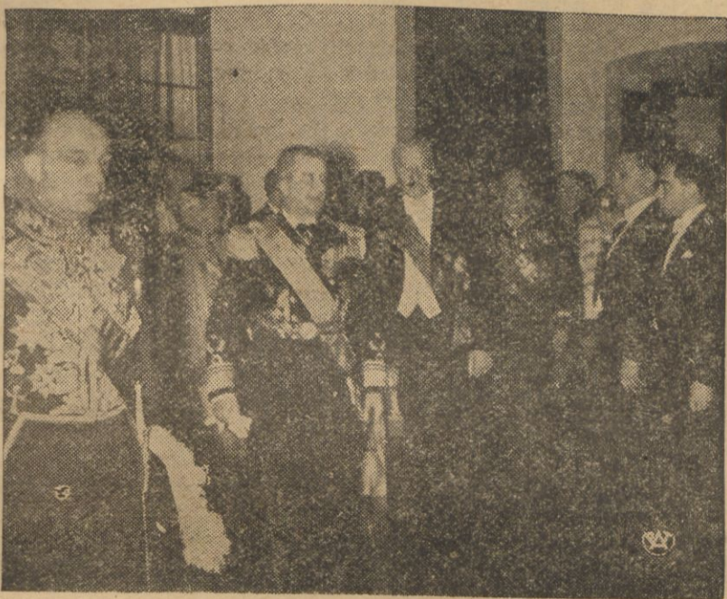
Moment z rautu, który odbył się w komnatach zamku wawelskiego po obiedzie wydanym na cześć Jego Wysokości. Widoczny Regent Horthy, Pan Prezydent R. P., Marszałek Śmigły Rydz, Dyrektor Protokołu Dyplomatycznego Romer i inni uczestnicy rautu.

RYGA (Pat). Donoszą z Kowna, że magistrat Kowna postanowił zburzyć domek, w którym w r. 1819 mieszkał Adam Mickiewicz i na miejsce tego domu wzniesić budynek konserwatorium muzycznego.