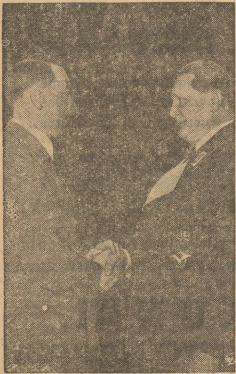
Kancelarz Rzeszy i naczelny wódz wszystkich sił zbrojnych Adolf Hitler składa gratulacje nowomianowanemu marszałkowi polnemu Hermanowi Goeringowi.

25 generałów i 90 pułkowników usuniętych z armii. Hitler — Goering — Himmler. Druga tajna rada przy Hitlerze. Co mówi radio sowieckie. Ribbentrop — najbardziej agresywny duch w niemieckiej polityce zagr.