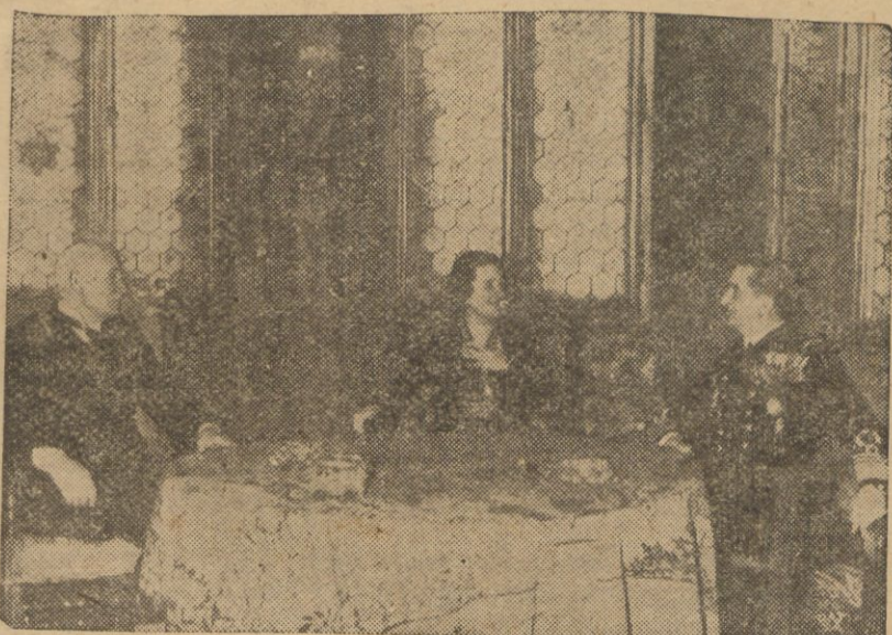
moment wizyty złożonej przez Jego Wysokość Regenta Horthy'ego Małżonce Pana Prezydenta R. P. Pani Marii Mościckiej w obecności Pana Prezydenta Rzeczypospolitej w apartamentach Zamku Wawelskiego.