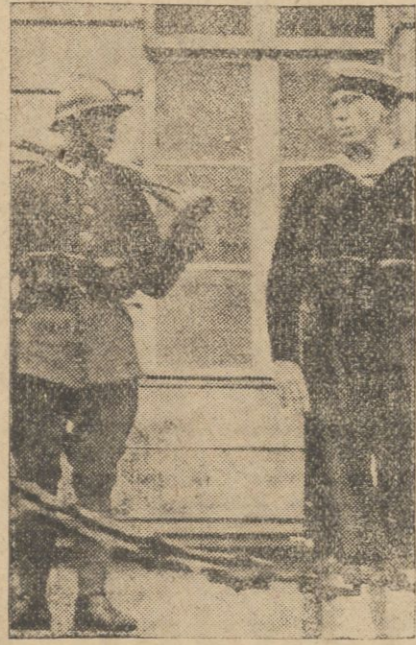
Dnia 28 ub.m. o godz. 13 odbyło się z okazji Święta Morza zaciągnięcie warty plutonu Szkoły Morskiej przed Komendą Miasta w Warszawie. Zdjęcie przedstawia moment zmiany warty.

Wobec przyjęcia oferty Radio Poznańskie z dniem 1 października wchodzi w stan likwidacji a rozgłośnia poznańska obejmuje w tym dniu Radio Polskie, — które zamontuje w Poznaniu nową 12 kw. nadstację.