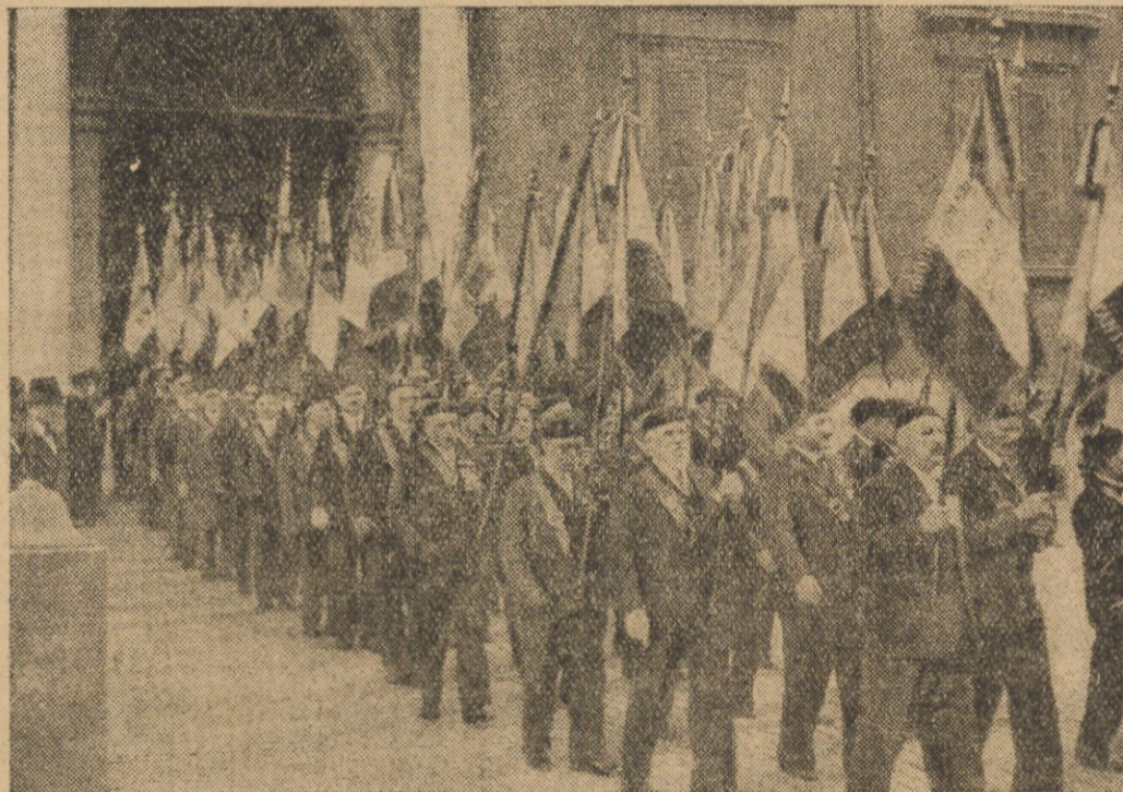
Ostatnio 2000 kombatantów francuskich złożyło wizytę kombatantom włoskim w Rzymie. Na ilustracji — kombatanci francuscy wychodzą z Kwirynatu, gdzie byli przyjęci przez króla.