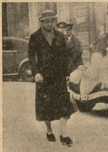
Zdjęcie nasze przedstawia podobiznę p. Jolliot-Curie, córkę znakomitej naszej rodaczki p. Marii Skłodowskiej-Curie. P. Jolliot Curie objęła jak wiadomo podsekretarjat stanu do spraw badań naukowych w rządzie Leona Bluma.