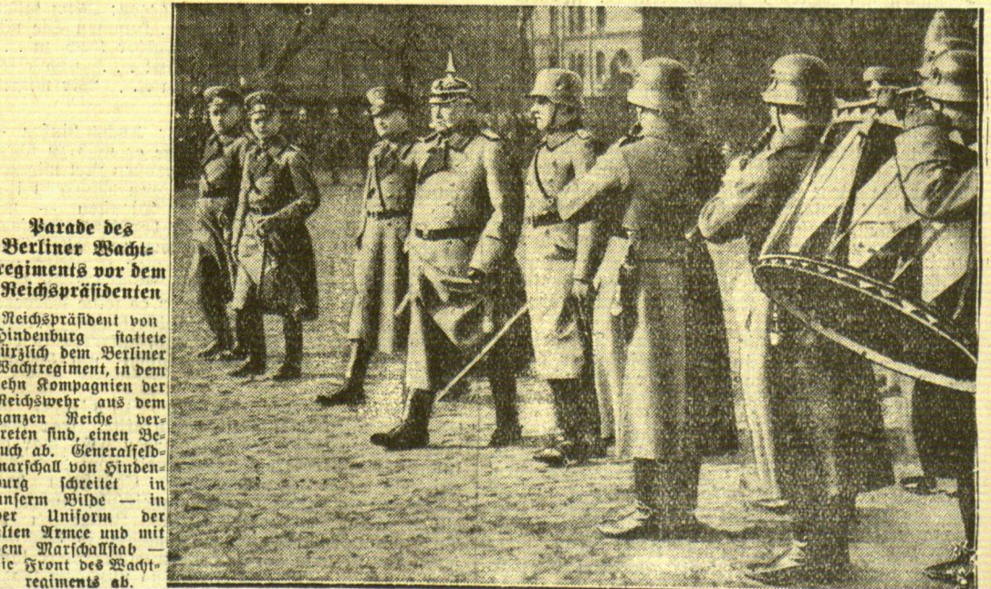
Parade des Berliner Wachregiments vor dem Reichspräsidenten

„cnb. Berlin, 6. März. Wie der „Antliche preussische Pressedienst“ mitteilt, hat der preussische Minister des Innern eine Anordnung über Ausnahmen von dem Verbot von Versammlungen und Umzügen unter freiem Himmel erlassen, in der es heißt: Im Hinblick auf die bevorstehende Wahl des Reichspräsidenten ermächtigt ich die Regierungen der Länder, politische Versammlungen und Umzüge unter freiem Himmel zuzulassen, sofern der friedliche und ungehört Ablauf der Veranstaltung gewährleistet erscheint.“