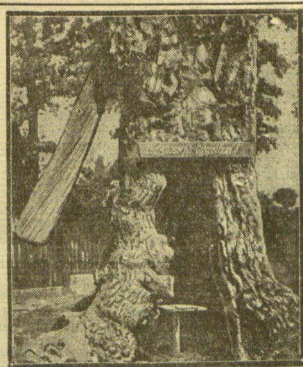
Nach eine Wachstube

Wth. Paris, 5. März. Der türkische Konsul in Marseille ist gestern mittag von einem Bürodiener des Konsulates durch mehrere Schüsse getötet worden. Der Mörder hat sich erschossen.