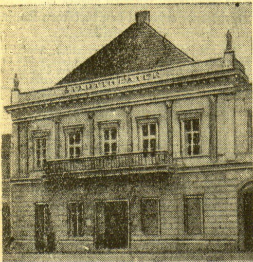
Das Zittauer Stadttheater niedergebrannt

cnb. Marbus, 5. März. Sechs junge Leute, die gefahren in dem Treibhaus einer Gärtnerei in Basse geschlafen haben, zogen sich eine schwere Kohlenoxydvergiftung zu, an deren Folgen zunächst drei und dann kurz darauf auch die letzten drei verstorben sind.