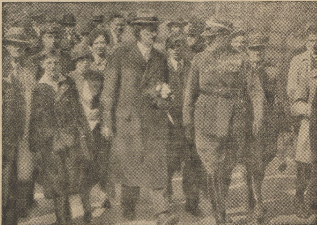
Z pobytu prof. Piccarda w Warszawie.

— Widzę jedno tylko uczciwe, odważne i przyzwoite wyjście z sytuacji z honorem. Jest to przyznanie się do popełnionych błędów i całkowite rozwiązanie się Legjonu Młodych. Każde inne rozstrzygnięcie postawi Legjon poza nawiasem środowiska i idei, doprowadzi poza to do nieuniknionego rozkładu wewnętrznego, co dla nikogo nie byłoby ani mile ani pożądane — zakończył p. Jędrzejewicz.